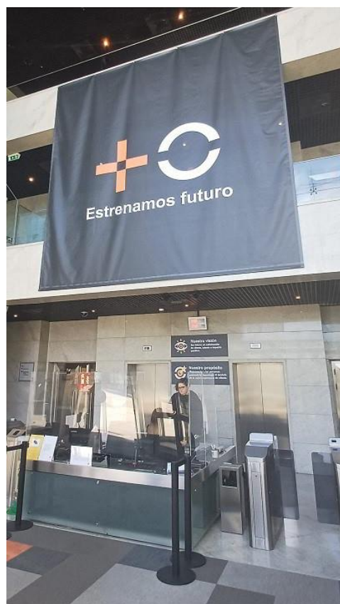
Colocamos una superbandera y así está todo arreglado...